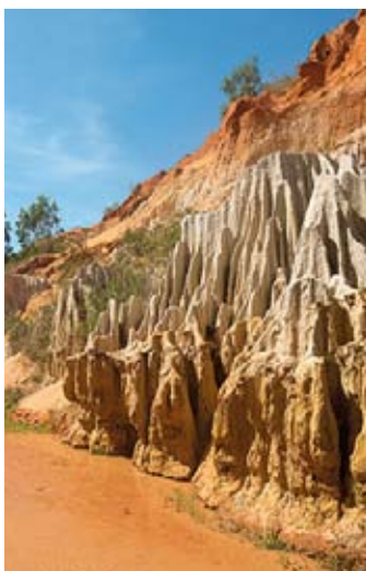
▲ Potok Wróżki

Potok Wróżki ⓘ Suôi Tiên; niedaleko wjazdu do wioski rybackiej Mui Ne, parking jest oznakowany – to niewielka rzeczka, która wije się wzdłuż kanionu stworzonego przez formacje